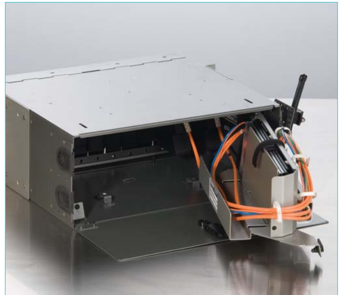
PCH-04U con la opción de empalme | Foto LAN738

Las unidades incluyen un soporte universal para cables patentado para aliviar la tensión de los cables y se cuenta con accesorios opcionales para empalme. Los distribuidores están contruidos con metal resistente y se envían con todo lo necesario para su instalación.