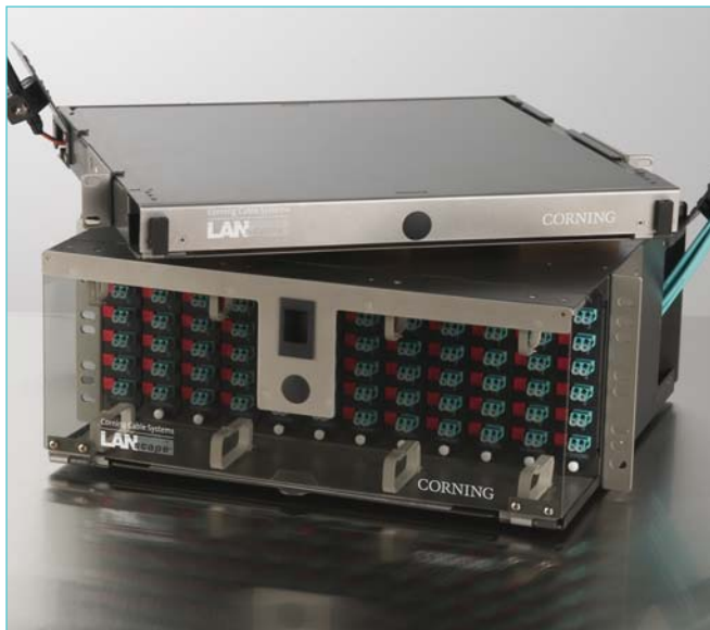
Distribuidores ópticos PCH-01U y PCH-04U